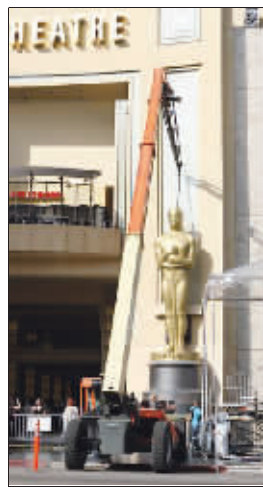
工人正在布置颁奖礼现场

为170万美元。今年最高价较去年相比上涨了7%,涨为每30秒182万美元。据美国媒体分析,今年奥斯卡颁奖前美国影视编剧工会长达3个多月的集体罢工一度让人怀疑典礼是否能够如期举行,因而大大激发了人们观看现场直播的兴趣。