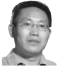
【学者视线之张耀杰专栏】

艳照门事件依然顽强地停留在人们的热点视线中,2月20日的《法制晚报》报道说,北京警方宣布赠阅200张以上艳照门图片者将被追究刑责,这个表态令艳照门事件再度成为关注焦点。其实在整个事件中,令我感到震惊的不是多达上千张的激情照,而是网友们对于明星们的私情、私事、私德表现出的慷慨激昂的道德热情与谴责,尤其是对于提倡对艳照门事件宽容的局外人“静姐”,很多网民居然也断然“挥舞道德大棒打击之”。