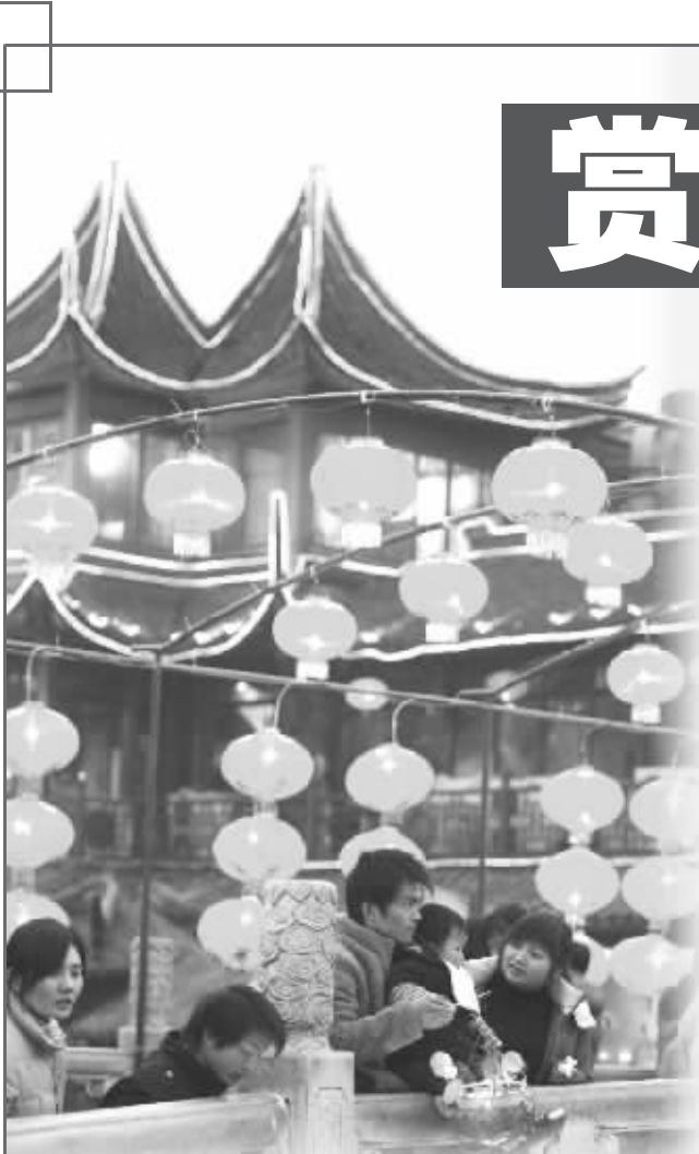
夫子庙昨天就已现灯海人潮