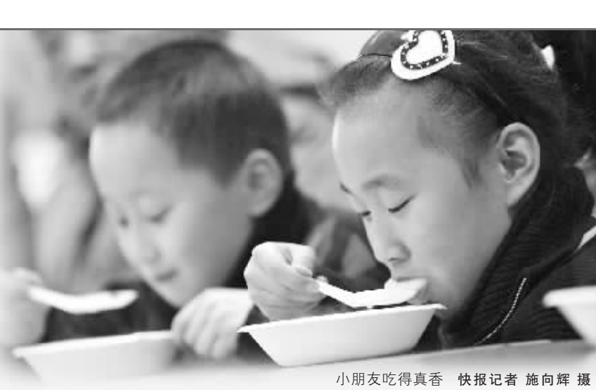
小朋友吃得真香

比赛结束后,经过清点,社区姚主任当场宣布媳妇队共包元宵201个,婆婆队共包元宵173个,媳妇队比婆婆队多包了28个元宵,媳妇队因此获得了这次比赛的“巧手奖”。 见习记者 王敬群