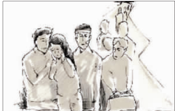
所幸的是16名游客都平安回来