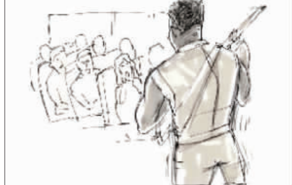
劫匪把巴士开到僻静处后对游客实施抢劫