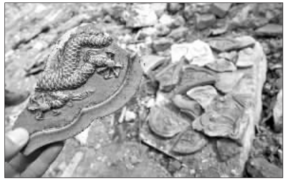
空地上有不少刻有龙爪的琉璃碎片

600多年前,明孝陵、明故宫、大报恩寺都堪称皇家大手笔。据说,朱元璋为完成这些恢宏之作,在南京城设置了72座御窑,专门烧制琉璃构件,10~20厘米厚,打上了淡黄、淡绿的皇家烙印,任凭风吹雨淋都不会褪色。