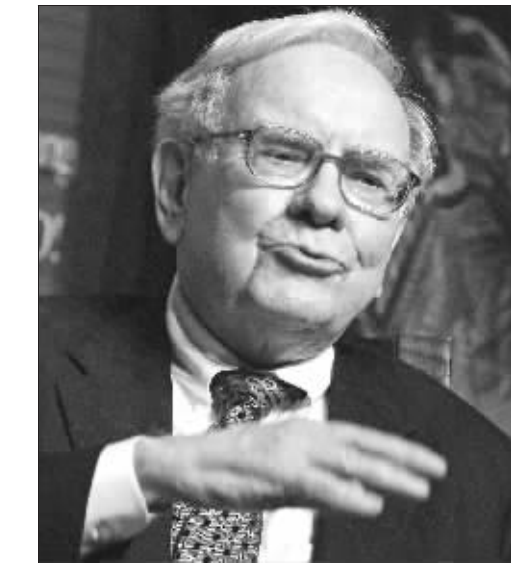
巴菲特主动出手,给不少投资人吃了一颗定心丸

保市政债券,但再保费用是债券保险业所收取保费的1.5倍。受次贷危机冲击,美国三大债券保险商近期都蒙受了巨大损失,仅MBIA一家去年第四季度就遭遇了23亿美元的创纪录亏损。