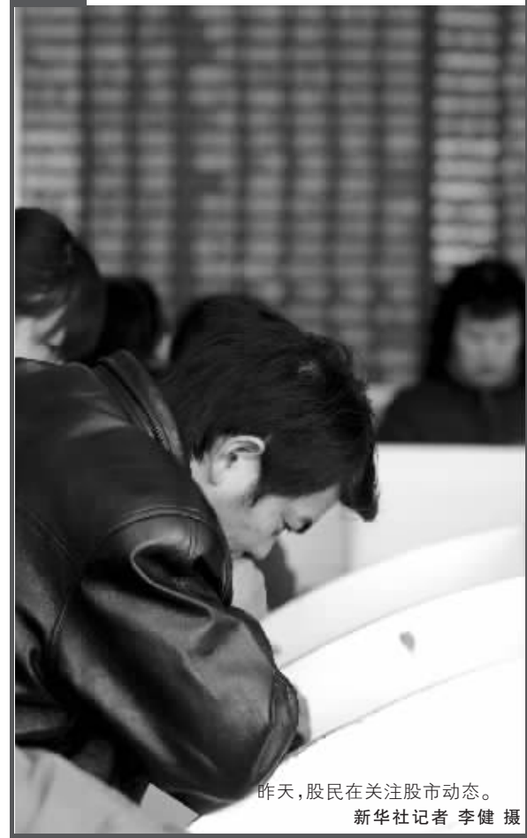
昨天,股民在关注股市动态。