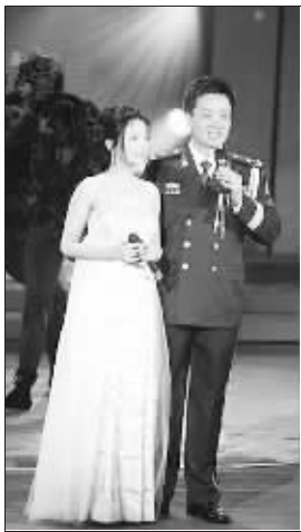
张燕(左)和阎维文(春晚节目)