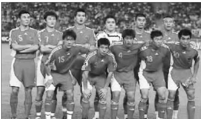
国足阵容 资料图片

在若干年以前,世界杯预选赛和春节联欢晚会是两个风马牛不相及的话题。但是2008年的新年除夕之夜,它们却被以一种极为无厘头的方式联系在一起:2月6日,当热热闹闹的春节联欢晚会大幕徐徐拉开时,中国国家足球队也将在西亚展开他们冲击2010年世界杯的征程。于是一个新的话题接踵而来:电视只有一个,你是选择看春晚还是看国足?如果正在犹豫不定,那么请套用周星星的一句至理名言:给个理由先!