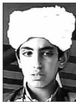
16岁的哈姆扎·本·拉丹

素有“铁蝴蝶”之称的巴基斯坦前总理贝·布托去年12月遇刺事件震惊了世界，幕后策划者至今仍众说纷纭。令人震惊的是，即将出版的一本贝·布托生前所写的自传惊爆秘闻称，企图暗杀她的元凶之一，竟是“基地”组织头目拉丹“最宠爱的小儿子”——16岁的哈姆扎·本·拉丹！