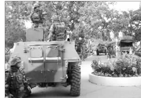
法国士兵护送侨民离开乍得