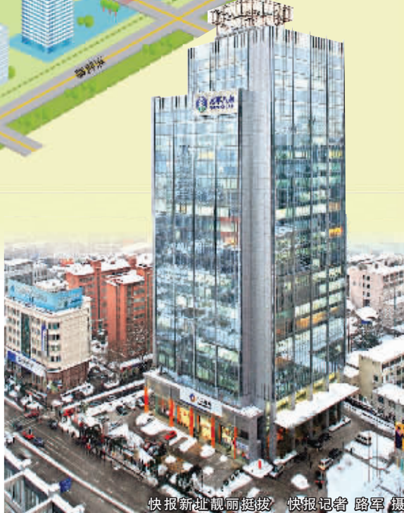
快报新址靓丽挺拔

另外, 要做分类广告的朋友注意了, 快报分类广告接待前台仍然在原来的正洪街东宇大厦一楼。