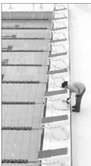
一名工作人员在国家游泳中心泳池边做保洁