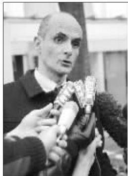
巴黎检察官办公室金融部门负责人在接受采访

有关法国兴业银行“流氓”交易员热罗姆·凯维埃尔的调查 27 日逐渐深入。法国调查人员当日说，调查富有成果。这些进展或许能在一定程度上解释人们心中疑惑，却也引发人们更多疑问。法国《费加罗报》援引业内专家的话分析，凯维埃尔可能是“替罪羊”。