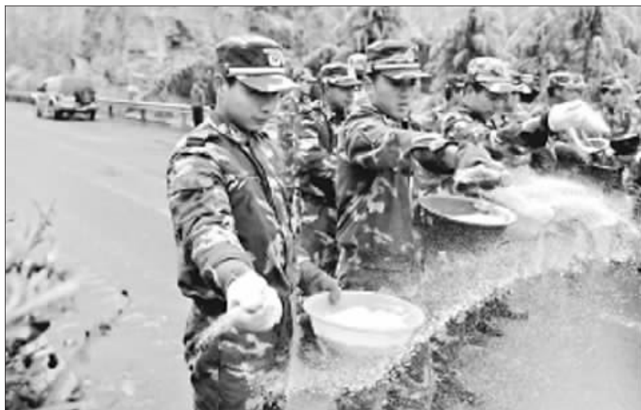
在通往贵阳机场的高速公路上武警官兵正在撒盐

连日来全国范围恶劣的天气像多米诺骨牌一般,引起了连锁反应:国道中断,交通受阻,通信不畅,菜价应声而涨,部分电网瘫痪……这场几十年未遇的雪冻灾害给我国部分地区的交通、电力、通信、农牧业以及百姓日常生活带来严重影响。据民政部发布的灾情信息,此次雪灾已造成安徽、河南、湖南、湖北、重庆、四川、贵州、陕西、甘肃、新疆等10省(区、市)3287.9万人受灾;农作物受灾面积1505.9千公顷;倒塌房屋3.1万间,损坏房屋11.5万间;因灾直接经济损失62.3亿元。