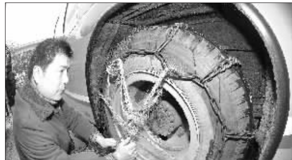
长沙一公交司机发车前检查防滑链

虽然小伙吃了罚单,但高兴之情溢于言表,口中不停地说道:“值,值,值”!民警哭笑不得。