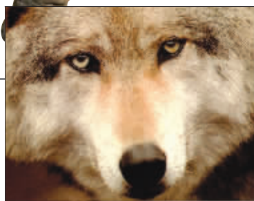
头狼太“独”也会倒台