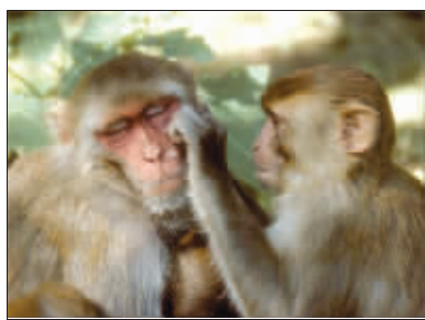
恒河猴:天下没有白溜的