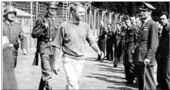
二战经典电影《大逃亡》剧照

二战经典电影《大逃亡》记录的是1944年关押在波兰纳粹“第三战俘营”中的盟军飞行员挖地道集体越狱的真实故事,英军飞行员伯特伦·詹姆斯,正是当年组织这次“大逃亡”的幕后策划者之一,而詹姆斯本人在其5年战俘生涯中,曾创纪录地越狱13次,堪称一名二战“越狱王”。1月18日,92岁高龄的詹姆斯因病去世,为他的传奇一生画上句号。