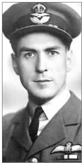
英军飞行员伯特伦·詹姆斯

二战经典电影《大逃亡》记录的是1944年关押在波兰纳粹“第三战俘营”中的盟军飞行员挖地道集体越狱的真实故事,英军飞行员伯特伦·詹姆斯,正是当年组织这次“大逃亡”的幕后策划者之一,而詹姆斯本人在其5年战俘生涯中,曾创纪录地越狱13次,堪称一名二战“越狱王”。1月18日,92岁高龄的詹姆斯因病去世,为他的传奇一生画上句号。