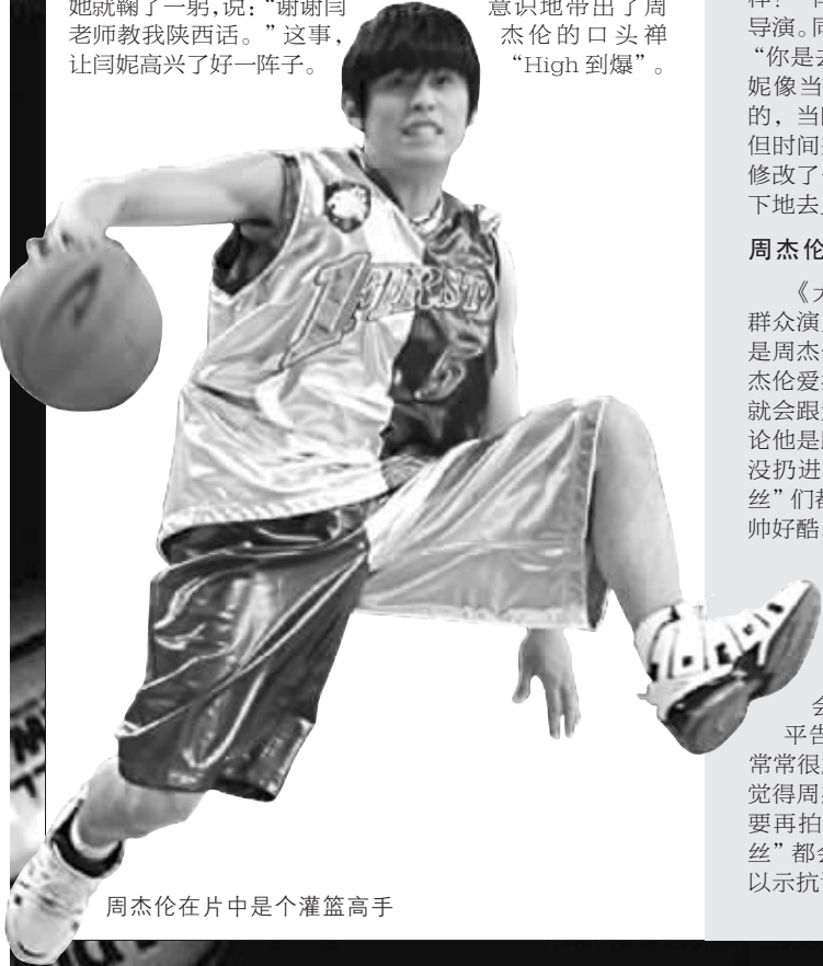
周杰伦在片中是个灌篮高手