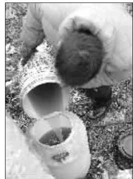
捞来的柴油被倒进桶里

大队一负责人告诉记者,他们已接到过类似举报,执法人员也到现场取样调查,“我们从上游的十月村开始排查,并没有发现沿途单位有排污现象。”该负责人表示,河面上漂浮的柴油估计是废弃的柴油,目前还无法确定其来源。