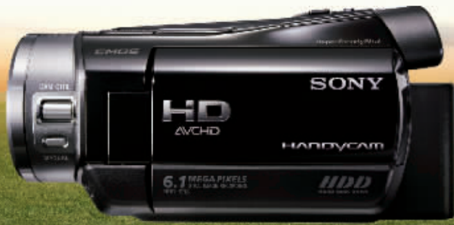
HDR-SR8E 100GB*硬盘高清数码摄像机