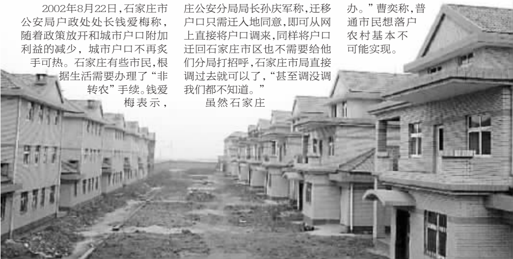
1月11日,计划建设18栋的“公安别墅”,已建成15栋

“想来就来,想走就走。”上庄公安分局局长孙庆军称,迁移户口只需迁入地同意,即可从网上直接将户口调来,同样将户口迁回石家庄市也不需要给他们分局打招呼,石家庄市局直接调过去就可以了,“甚至调过我们都不知道。”