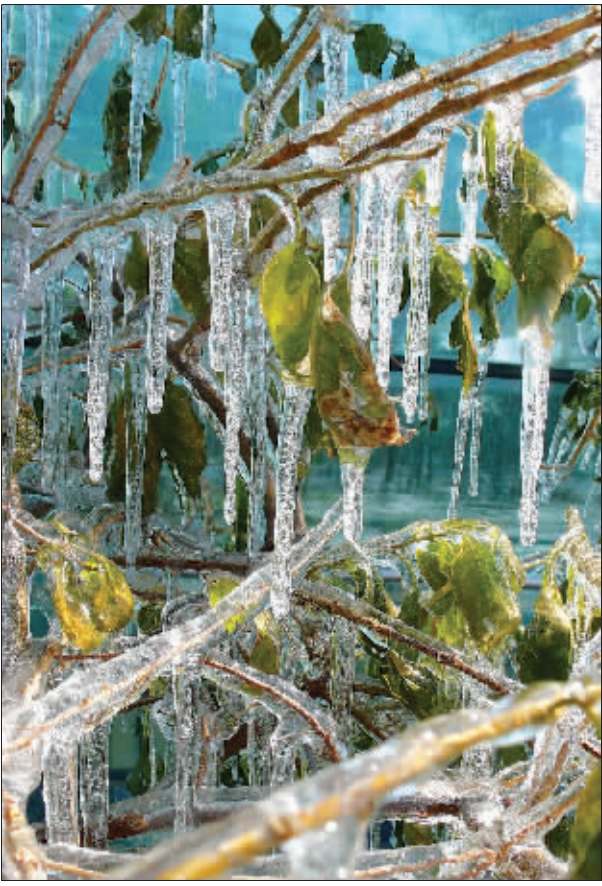
美丽的冰凌

1月9日至1月17日是我们熟知的“三九”,今年恰好应了“三九四九冰上走”这句话。气象专家告诉记者,今年冬季气候似乎较去年正常一些,但今年1月上旬,南京平均气温4.5℃,仍比常年偏高2℃。因此,断定今年是“冷冬”还有点早。根据省气象台长期预报显示,1月中旬全省降水将偏多一些,气温有可能仍然偏高,17日及20日全省还各有一次降水过程。