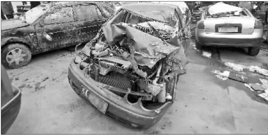
多辆车被撞致严重变形

山出口三公里处,一下被堵在了路上。孙先生称,3个车道堵满了车子,排起四五公里的长龙。从当晚8点多到12点多这受阻的4个小时中,孙先生看到从镇江方向过来的警车和急救车,呼啸着来回跑个不停。