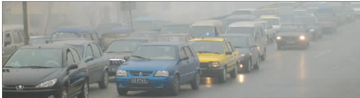
浓雾使得准备过南京长江大桥的车辆大量堵塞并排起了长队

这几天随着气温回升,空气中的湿度增加,加重了南京的雾霾天气,昨天江苏省气象台发布了入冬以来第三次大雾红色预警。省气象台专家告诉记者,这场雾的威力和去年12月份的两场大雾旗鼓相当,专家表示,今天仍会有雾但是程度会有所减轻。另外,受北方冷空气的影响,从后天开始,南京可能会出现降温天气,并伴随着雨雪。