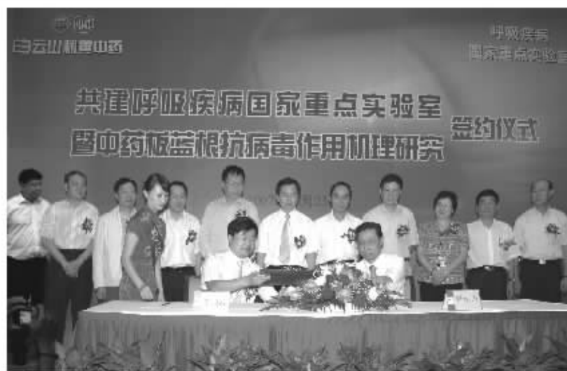
2007年10月23日，广药集团董事副总经理、广州白云山和黄中药有限公司总经理李楚源与呼吸疾病国家重点实验室主任钟南山院士共同签署有关共建合作文件，开创我国企业共建国家重点实验室的先河。

30多年以来，由中国自主研发的青蒿素一直是“中国自主研发而对世界有重大影响的药物”。在签约仪式上，钟南山院士亲自担纲，率领英国爱丁堡大学、浙江大学、同济医院等“多国部队”联合开展板蓝根抗病毒作用机理研究。钟院士表示，板蓝根作为治疗流感、发热的中成药由来已久，使用广泛，尤其是在2003年中发挥巨大作用后，白云山和黄则是全国最大的生产企业，市场占有率过半。板蓝根的抗病毒作用机理研究清楚，将在走出国门，成为第二个“青蒿素”。