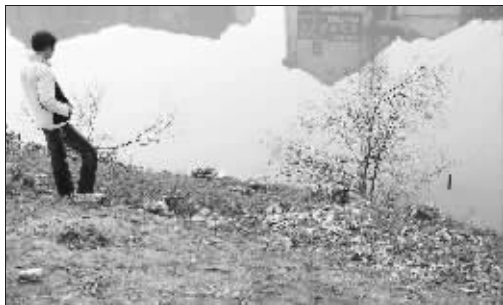
事发地张家港德积的一处河道