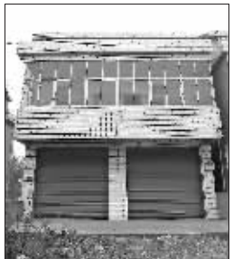
为这套房,夫妇俩和女婿打起房屋确权官司