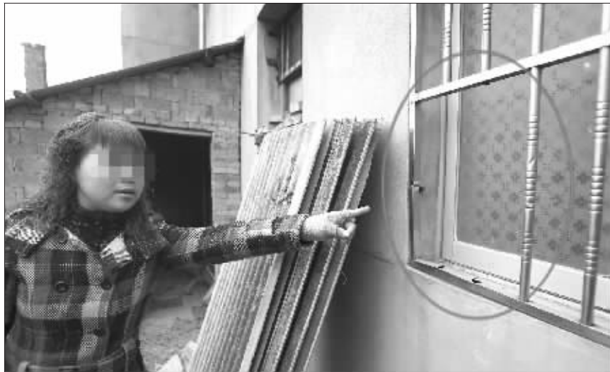
当时,歹徒就是从这里进屋杀害了母子俩