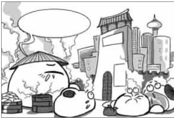
对照对照,俺们这些长相的都不能叫馒头了! 漫画 马菁

了解到,目前速冻馒头已经纳入了食品生产许可证管理制度,但现蒸馒头还没有实行QS管理,不过用于蒸馒头的面已经开始施行QS管理,“现蒸馒头市场情况比较复杂,生产许可证管理很难推行。”相关工作人员称。