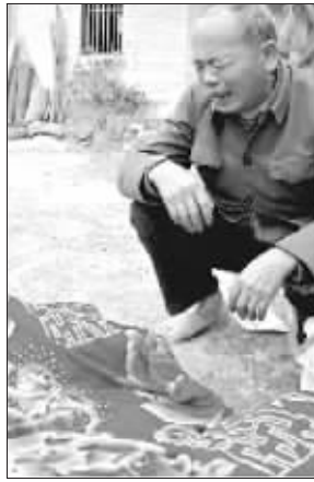
死者家属在尸体边痛哭流涕

一名从未走出过深山的农妇,挥起六七十厘米长的砍柴刀,砍向她堂弟的母亲、老婆、两个未成年的堂侄和她的婶子,甚至连堂弟门前的一条小狗也没放过,疯狂的砍刀拼命地砍向他们的头部,其中最小的不足2岁的堂侄头部被连砍8刀,砍到整个头只剩下面部,砍完现场所有的活口后,她开始放火烧她叔叔的屋子,再跳上屋顶用砍刀将屋顶瓦片全部打碎,冲进屋内砸烂所有的东西,直至警方赶到,她仍然在屋顶上不停地挥舞着砍刀,她疯了吗?在鉴定结果出来前,谁也无法做出判断,在家属和村民看来,出事之前,农妇一直处于正常状态,最多有时跟别人争吵一番。