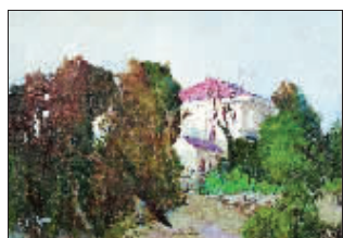
李建国《夕阳的农家院》