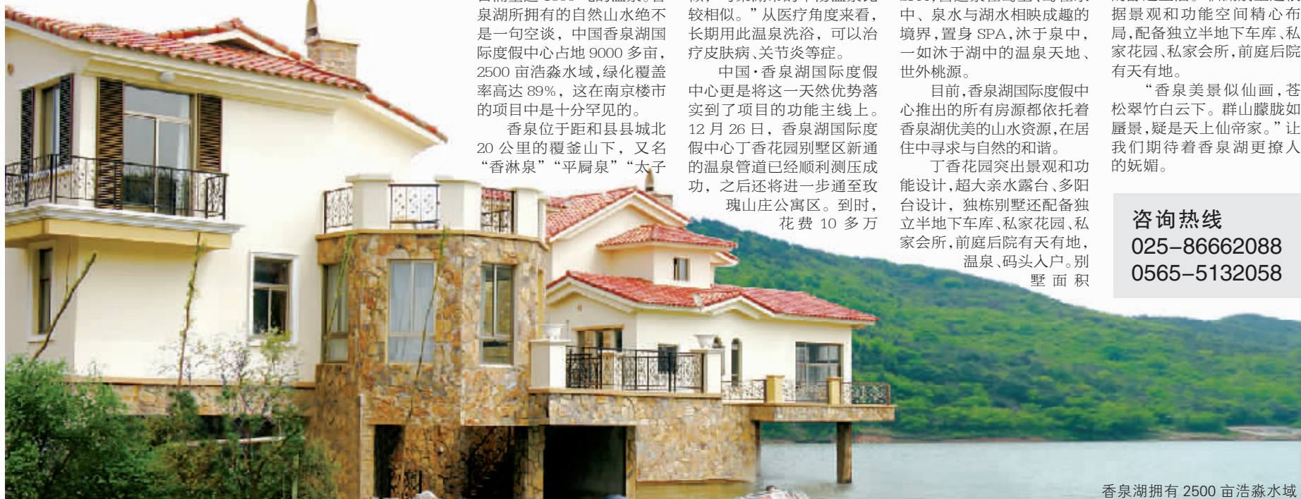
香泉湖拥有 2500 亩浩淼水域

我们都渴望有一个地方,可以自由轻松,没有喧嚣,没有污染。在生命的数量与容量都无法得到大的提高时,努力使生命的质量有所提高,让自己流连于鸟语花香,忘情于绿野清泉,在余暇时,可以全身心地归属于大自然。作为安徽省 861 重点工程的中国香泉湖国际度假中心,地处皖东,属于“南京一小时都市圈”范畴。境内有群山环绕的昭明湖,更有日涌量达 1600 吨的温泉。香泉湖所拥有的自然山水绝不是一句空谈,中国香泉湖国际度假中心占地 9000 多亩,2500 亩浩淼水域,绿化覆盖率高达 89%,这在南京楼市的项目中是十分罕见的。