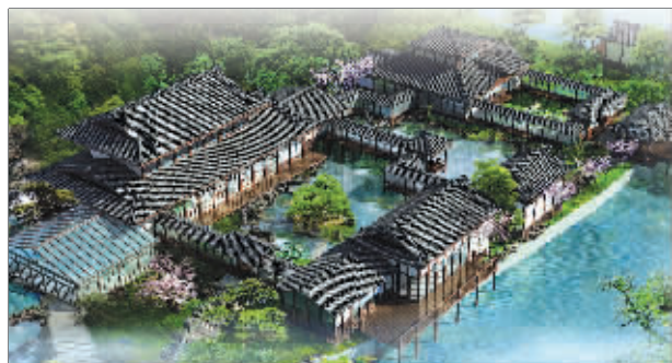
远离城市喧嚣的香泉湖国际度假中心