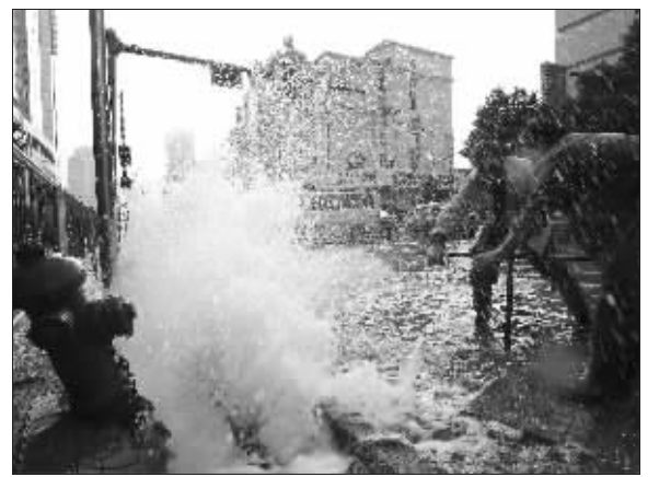
消防栓被撞断,工作人员紧急抢修