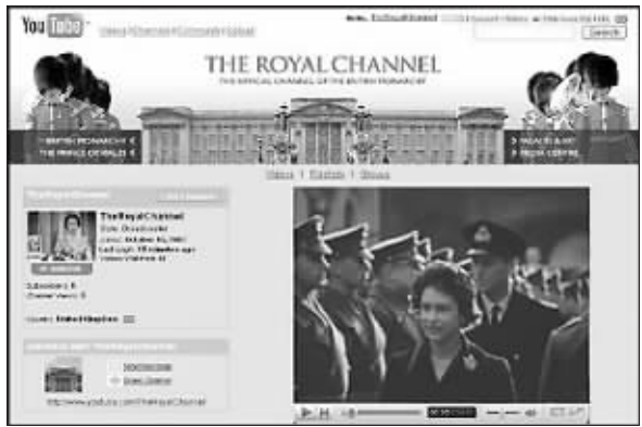
Youtube开通了“英国王室频道”