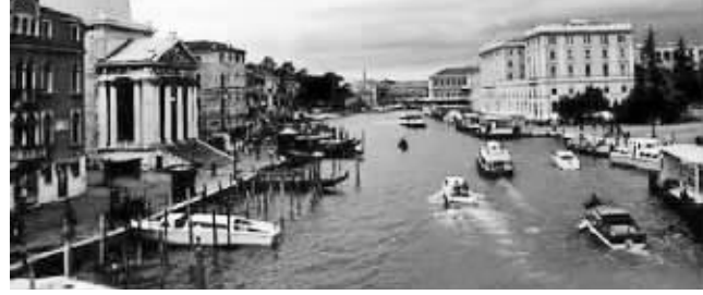
海水回灌现象将会令威尼斯的美景消亡?

不过对于这种“末日旅游”也有一些批评的声音,有关人士指出,这种行为会加速对环境的破坏,因为当旅游者乘坐飞机或采取其他方式出行时,会造成更多温室气体的排放,加速全球变暖的步伐。 欧叶