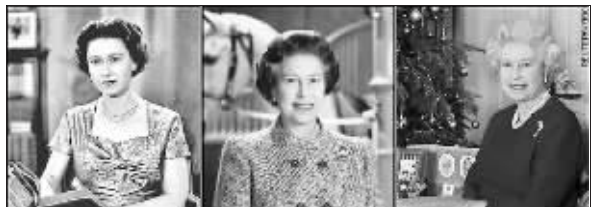
女王1957年、1986年和2001年发表圣诞演讲的画面

伊丽莎白二世20日下午5时成为英国历史上最年长的君主,打破了高曾祖母维多利亚女王的81岁零243天的纪录。但伊丽莎白二世从未因年龄增长而落后于时代。2005年,她购买了一个i-Pod,她的二儿子安德鲁王子2001年送给她一部手机并教会她如何使用。早在1976年,女王就在英军的一个基地里发出了她的首封电子邮件,上世纪90年代末互联网浪潮风起云涌时,她又因投资新技术而赚了几百万。 康娟