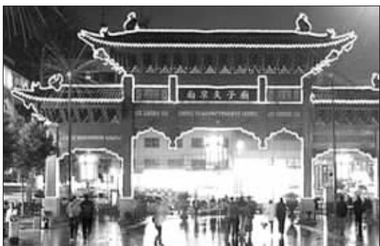
夫子庙区域是南京的热点商圈之一 资料图片