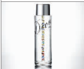
伏尔加酒 804 万元