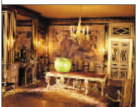
微型屋 52 万元

圣诞节将至,小孩子们都在等着圣诞老人从烟囱下来派送礼物。但是对于似乎已经拥有一切的俄罗斯寡头来说,世界上还是有一些值得拥有的奢侈品。最近,有英国媒体评选出十种最昂贵的“终极礼物”,相信它们可以满足寡头们的“圣诞欲望”。