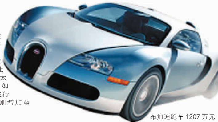
布加迪跑车 1207 万元

布加迪制造的 Veyron 16.4 跑车是世界上动力最强劲,速度极快,同时也是最贵的跑车。它由大众汽车公司制造,最高时速可以达到 253 公里,价格为 1207 万元。