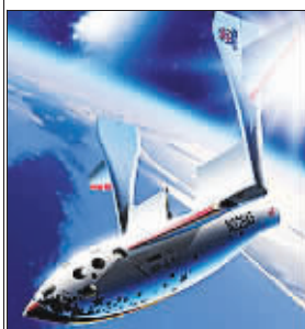
失重体验 149 万元