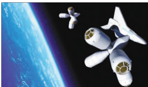
太空行走 4.17 亿元