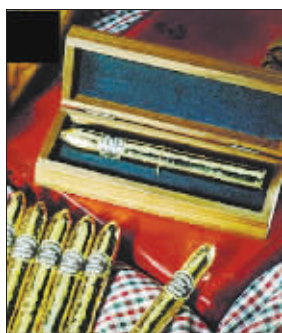
"金装"雪茄 2219 元