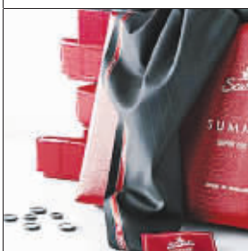
宝石服装面料 22341 元