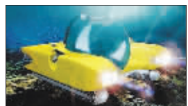
观赏潜艇 1050 万元

美国著名的百货公司 Neiman Marcus 总是能给富豪们找到合适的玩具,最近他们发布的 Gem Triton 1000 潜艇,不仅可以潜到 304 米的海底,还能全方位地观察水下的美景。潜艇的售价为 1050 万元。