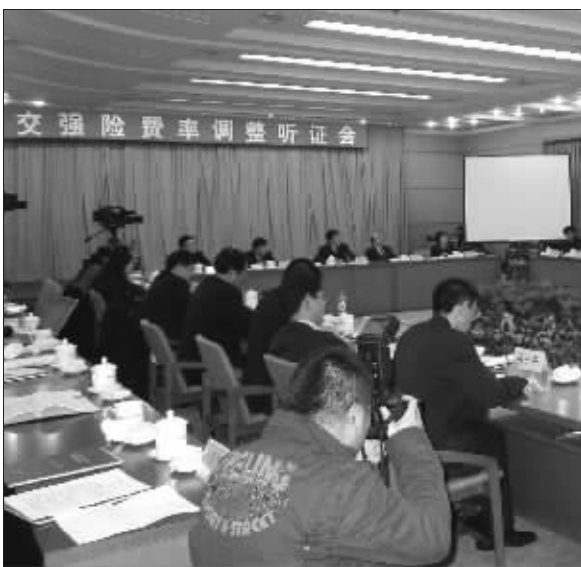
昨天,交强险费率调整听证会举行。

他认为,第三者责任应该主要保障人身。交强险中的医疗费用赔偿限额为8000元,而现在住院动辄两三万,尤其是交通事故造成的伤害非常大,受的都是头部或者胸部的伤,8000元明显偏低,这应该需要按实际情况加以修改。