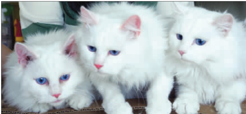
韩国科技部 12 日公布的照片显示了 3 只具有荧光蛋白基因的克隆猫

即使在黑暗中,猫的双眼依然闪亮。如今韩国科学家克隆出了不只双眼,而是全身都可在黑暗中发光的小猫。此类克隆猫不仅给宠物迷们带来新的乐趣,还有望攻克人类由基因导致的遗传性疾病。