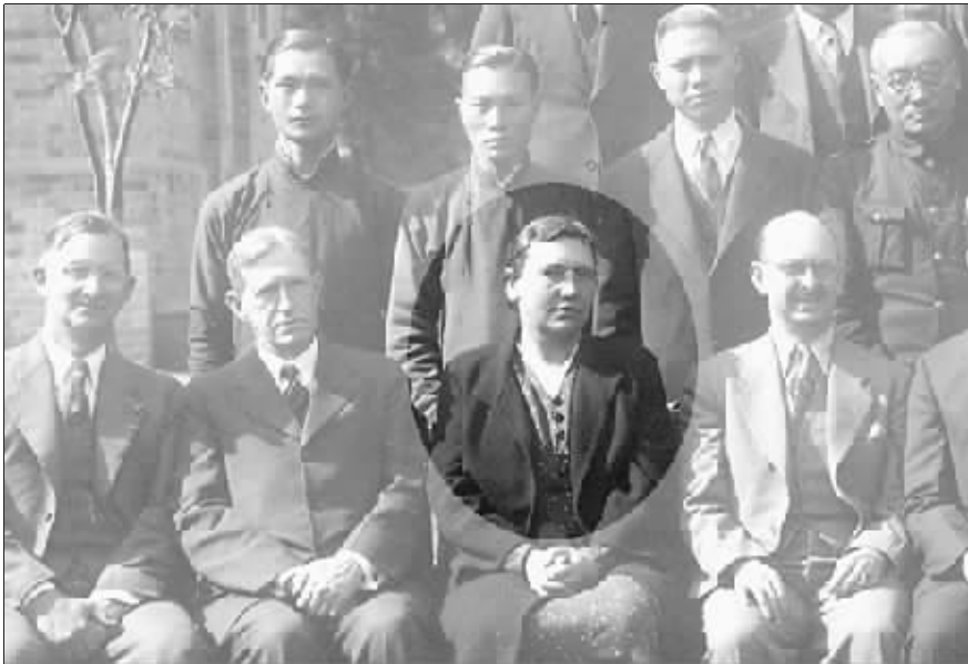
鲍恩典女士在南京的留影 资料图片

1937年12月12日深夜,鼓楼医院的楼内不时传来“嗒嗒”打字的声音,一个慈眉善目的美国女士,在忙完了全部伤员后,借着微弱的灯光,用老式打字机打着“地狱开始降临了”,此时窗外枪声不断,南京即将沦陷。这位女士就是鲍恩典,一个终生未婚献身事业的美国医生,一个让李秀英生前念叨着“要见上一面”的老熟人,一个从1937年11月开始,将自己的亲身经历写进了日记的人。如今,这本有着423页的日记,被认为是“南京大屠杀”又一个铁证,昨天,南京鼓楼医院将这本日记公之于世。