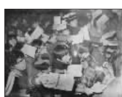
首发式上《南京大屠杀》被市民抢购一空