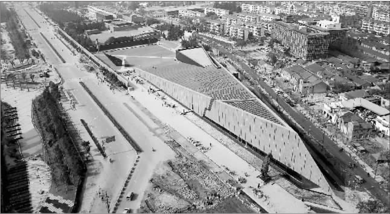
江东门纪念馆新馆造型如一条“和平之舟”

快报讯(记者 毛丽萍 陈英)明天,凄厉的警报声又将响起,而投资3亿多元扩建的侵华日军南京大屠杀遇难同胞纪念馆也将竣工开放。新展馆,整体形状犹如一艘巨大的“和平之舟”,与原馆相比,新馆区的占地面积增长了3倍,达到7.4万平方米,建筑面积扩大为2.5万平方米,展示的文物从100多件扩大为3000多件。据了解,新馆明天就将全面向市民免费开放。