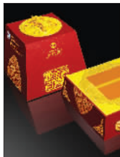
限量版五粮液红的个性