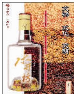
水井坊的设计匠心独具