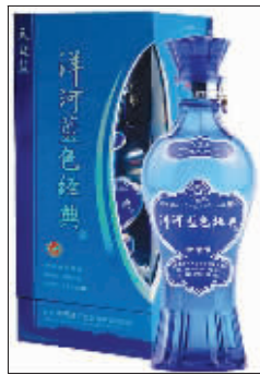
经典蓝色让洋河时尚十足