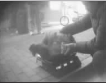
记者用电子秤核称,发现少了2斤3两