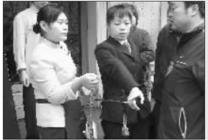
当着稽查的面,金老汉经理连称秤没问题