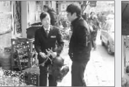
稽查刚走,“金老汉”又用起杆秤