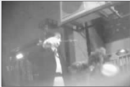
“阿婆”烧鸡公的服务员在称鸡