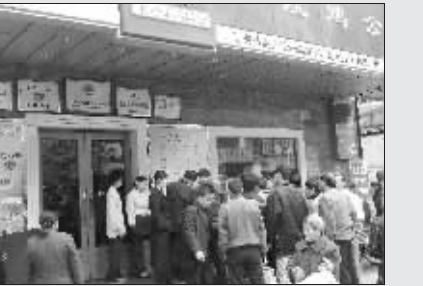
鬼秤伎俩被识破后,路人纷纷指责“金老汉”