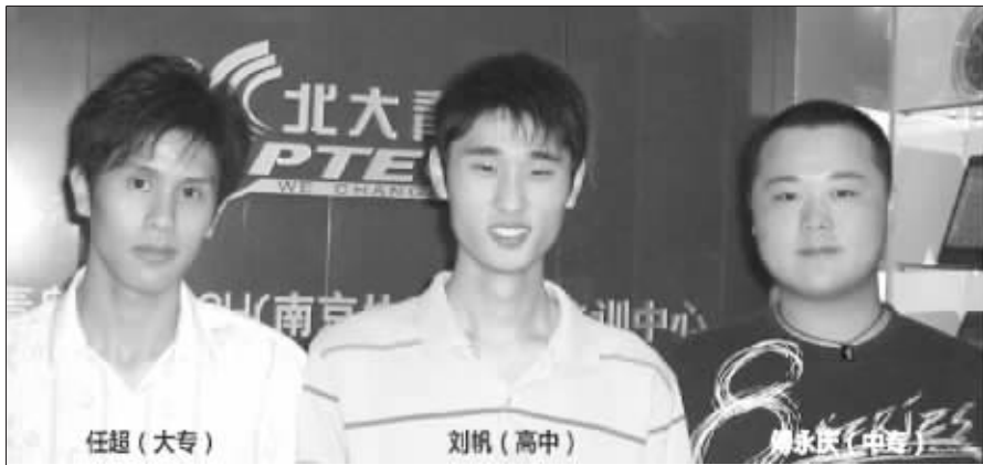
9月初,南京协同3名学员飞赴新加坡 OPUS 公司任职

BENET 网络工程师培训基地:珠江路 222 号长发数码大厦 9 楼(莲花桥站)