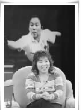
美丽的她 (资料图片)

在两届奥运会上拿到4枚奥运会金牌,同时也是惟一一位蝉联奥运会乒乓球冠军的运动员,邓亚萍被称为“乒乓球场上的奇迹”。其实,离开了乒乓球台的邓亚萍同样是一个奇迹,在退役后的短短10年间,邓亚萍从分不清26个英文字母大小写的“傻丫头”,变成了清华大学英语系的毕业生,直到现在成为英国剑桥大学的博士在读生。无论多少次变换自己的身份,邓亚萍对待奥运会的那份感情一直没变:北京刚刚提出申办2008年奥运会的时候,邓亚萍积极参与;北京申奥成功后,邓亚萍又很快成为北京奥组委的官员,现在更是当起了北京奥运会奥运村部副部长。“这是一个需要投入很多时间和精力”的工作,邓亚萍在接受采访时表示。也正因如此,邓亚萍甚至没有时间照顾自己18个月的儿子,然而在她看来,这样的付出值得,因为“一生中能有机会为奥运会贡献力量,比在奥运会上夺金牌更加令人兴奋”。