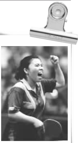
拼搏的她 (资料图片)