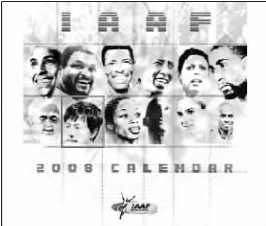
国际田联推出的挂历

训练结束后,有人把从摩纳哥国际田联总部带回来的有刘翔的挂历和写真集交给了刘翔,刘翔甚是兴奋,挂历随便翻翻,先扔一边,对自己的写真集却是明显很感兴趣,拿过来翻来覆去地看,还指着给队友看,作出“这张如何如何”的评价。