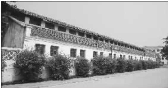
国民党中央军人监狱旧址