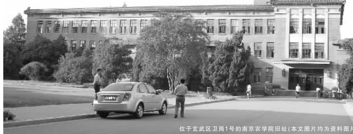
位于玄武区卫岗1号的南京农学院旧址(本文图片均为资料图片)