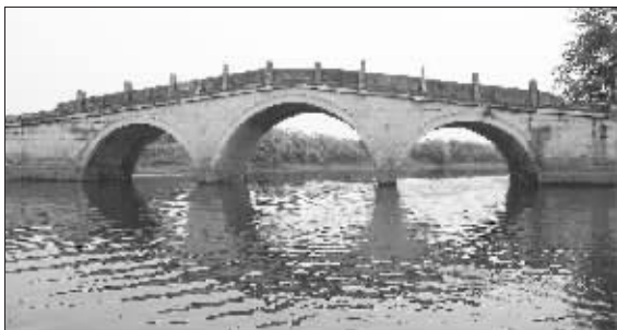
始建于明朝,1917年重建的高淳沛桥