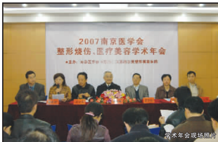
学术年会现场照片

打开电视,韩国人造美女大行其道;翻开报纸,整形故事丰富多彩;登录网站,整形事故却也不少。11月24日,“2007南京医学会整形烧伤、医疗美容学术年会”及“安