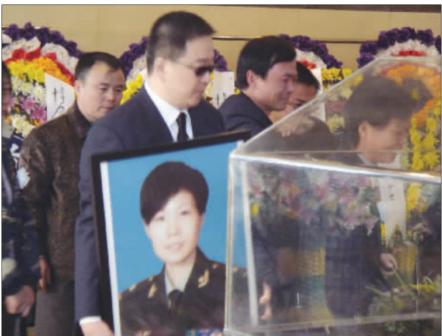
丈夫手捧叶凡的遗像

“为歌而生,踏歌而去”,在巨大的挽联下,年仅37岁的叶凡静静地躺在白玫瑰花瓣之中,走完了她的艺术之路。昨日,叶凡的遗体告别仪式在广州银河园殡仪馆举行,在白玫瑰围绕的水晶棺内,叶凡安静地躺在花瓣中,灵堂没有播放哀乐,一直放着她生前最喜欢的歌曲《女儿行》、《相思苦》,四周摆放着各界友人敬送的花圈,著名歌唱家彭丽媛、戴玉强,作曲家徐沛东、金铁林,演员郭达,央视主持人毕福剑以及歌手江涛、沙宝亮、张也等都在挽联上表达了无限的哀思。在追悼会进行期间,叶凡的姐姐刘女士几次扑倒在水晶棺前,失声痛哭……据悉,叶凡的骨灰已于昨晚由家人运抵南京,12月1日上午将安葬在功德园。