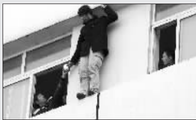
小伙接过消防队员递来的开水