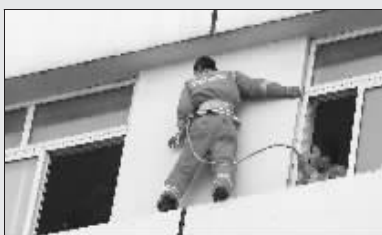
消防队员爬窗台营救