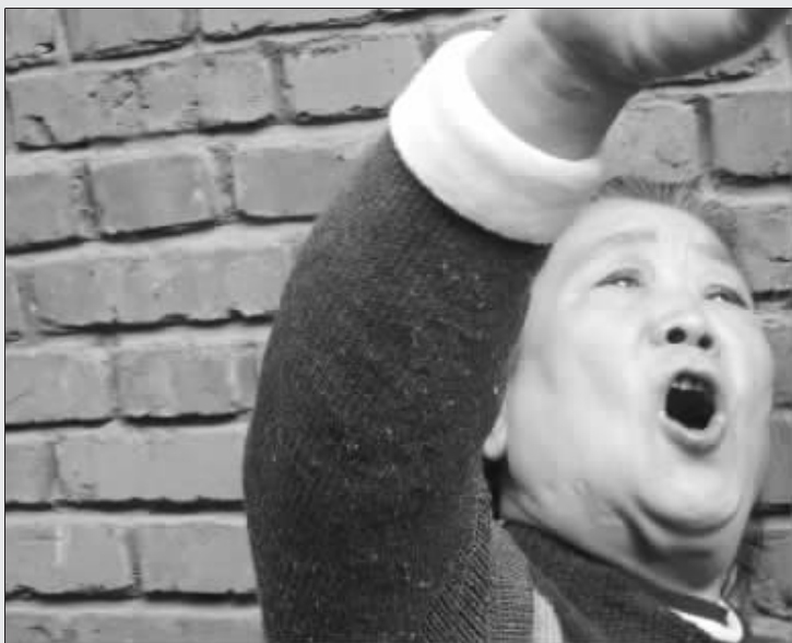
朱老太太用嘶哑的嗓子苦劝小伙

大学毕业后工作受挫,到上海会女友又谈崩了。昨天早上8时,一位湖北小伙一时想不开,爬到南京火车站西侧一宾馆的6楼窗外要自杀。这几天降温,小伙冻得直发抖,6个半小时后,小伙才被民警和热心老太太劝下。