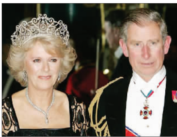
查尔斯王储夫妇(资料图片)

据英国媒体报道,查尔斯连登基后的名号都想好了。因为查尔斯的全名是“查尔斯·菲利普·阿瑟·乔治”,所以他想用“乔治七世”,而不准备用“查尔斯三世”的称号。因为“查尔斯三世”不吉利,英国历史上几个叫查尔斯的国王下场都不好。