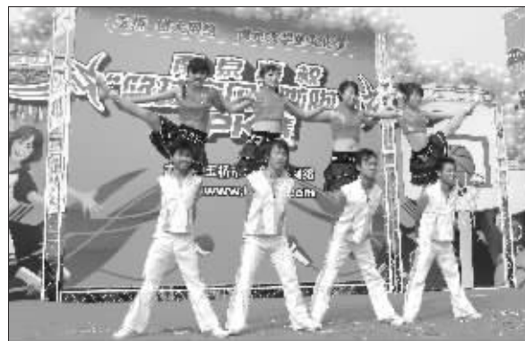
“男女宝贝”配合默契