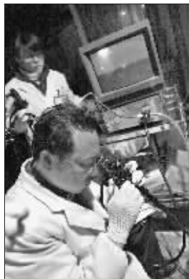
医生在给海豚仔细检查

突然,屏幕上出现一些黑黑的东西。难道是异物?吴医生将铁丝一样细细长长的异物钳慢慢伸进去,试探了几下,却碰不到什么东西,取出