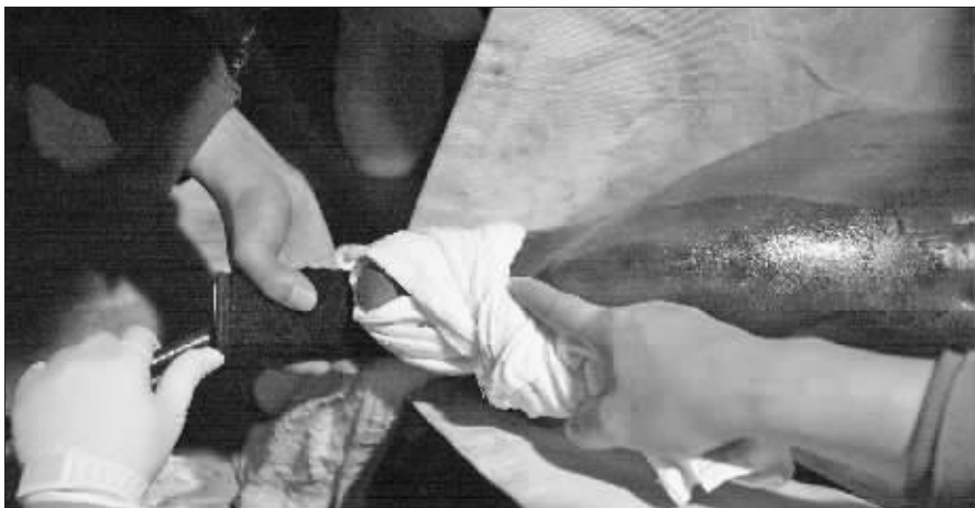
专家将胃镜探头缓缓伸入海豚食道

还记得两个月前快报跟踪报道的那两只日本海豚吗?9月初,它们从日本远渡重洋来到南京海底世界。谁也没想到,一块砖头大小的海绵,竟然藏在海豚胃里,跟着到了南京。 直到昨天清晨,迟钝的海豚觉得胃部不舒服,终于将它吐了出来,这么大一个异物,可吓坏了工作人员。赶紧向医院求救,为它们做了个彻底的胃镜检查。