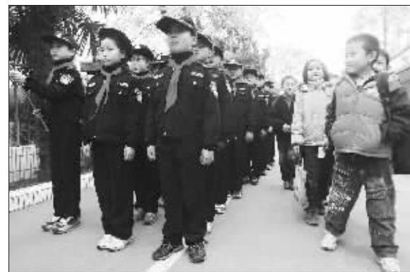
长江路小学小巡警中队学生正在训练