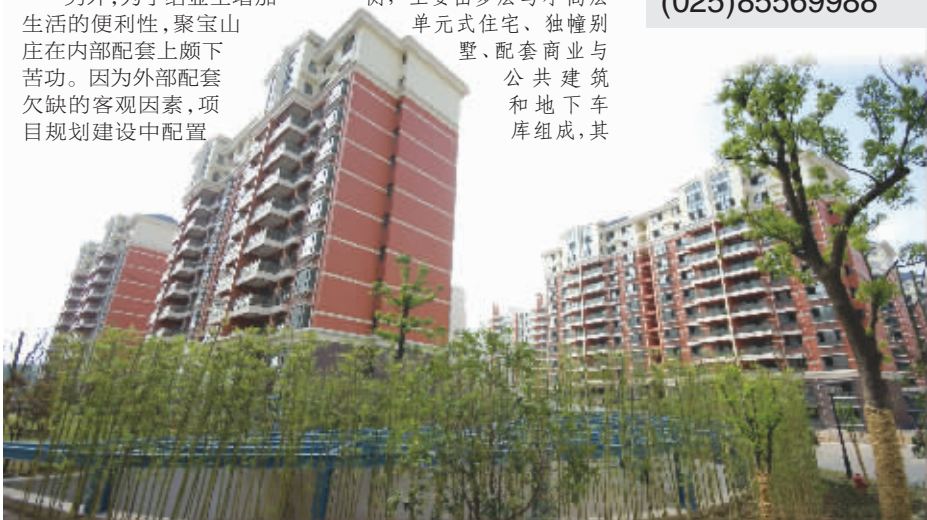
本版图片均为阳光聚宝山庄实景图