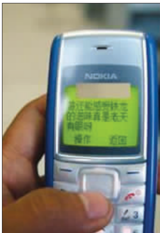
恐吓短信

你两(俩)跳墙跑了,邻居来找我,我让他们告诉警察,我把你们两个的护照复印件给了他们,明天会通缉的。你们不知道吧?这里是不可以爬墙头的,不回来拍照了,但现在还要看我一句话,如果我改变主意,你们都没有救了,在警察局的铁笼子里可不舒服呀,哈哈!不花钱来非洲旅游还感受铁龙(笼)的滋味真是老天有眼呀!