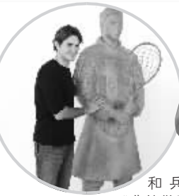
和兵马俑“费德勒”合影